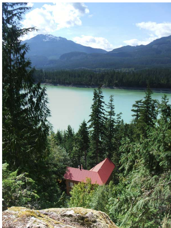
Alojamento principal do SSRC, com vista para o Lago Daisy e o Monte Cloudburst no horizonte.

Budismo Tibetano. Praticando um método budista-tibetano antigo e esotérico para restaurar a harmonia ambiental e estabelecer a paz, voluntários do SSRC coordenam a colocação de Vasos da Paz em locais cuidadosamente selecionados em todo o Canadá. Retiros no SSRC para membros da comunidade Siddhartha's Intent são conduzidos de acordo com a tradição da linhagem Khyentse, do fundador do SSRC, Dzongsar Khyentse Rinpoche. Porém, o SSRC também propicia um ambiente contemplativo para praticantes de múltiplas tradições que aspiram à não violência e buscam equilíbrio interior. Embora tenha seu próprio caminho de meditação, estudo e ação, a linhagem Khyentse é famosa no Tibete pela diligência adotada por seus detentores no sentido de ajudar a sustentar a integridade de muitas diferentes tradições. Em consonância com tal atividade não-sectária , o SSRC hospeda diversos programas, abarcando vários caminhos espirituais. Cada retiro em grupo é conduzido à sua única e particular maneira.