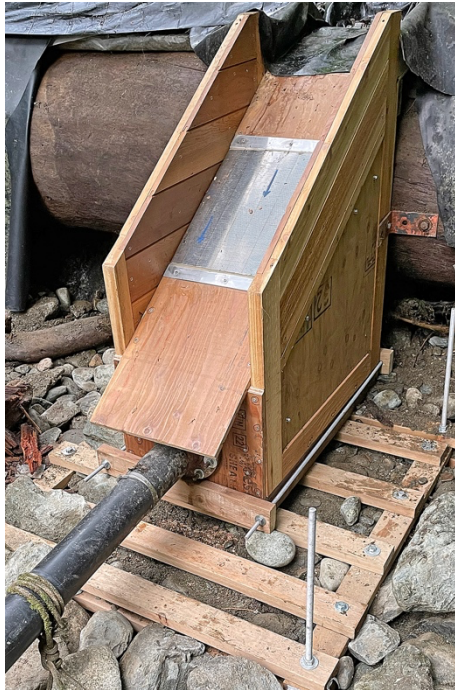
Caja de entrada de agua, en el Arroyo Marble

Ahora que ya teníamos energía solar, tuvimos que darle un poco de atención a nuestro sistema de energía hidroeléctrica . Después de 16 años de servicio en el Arroyo Marble, la caja de entrada, de cedro, necesitaba ser reemplazada. Construimos una nueva caja en nuestro taller. No hace falta decir que un tanque de agua requiere materiales especiales, un diseño único y hábil carpintería. La caja fue construida con un diseño modular para que pudiera ser desarmada en componentes y luego reensamblada en el sitio. Una vez construida, tuvimos que averiguar cómo transportar 80kg de herramientas y materiales a lo largo de dos kilómetros por un sendero sinuoso y denso en el bosque. Consideramos la idea de usar un helicóptero – pero... ¡caro! Una carretilla eléctrica – hmmm, si fuera un camino llano, seguro, pero no. ¿Un burro?... Por fin, las buenas y viejas mulas humanas lograron llevar todo lo que correspondía. ¡Gracias a ustedes, maravillosas mulas humanas!