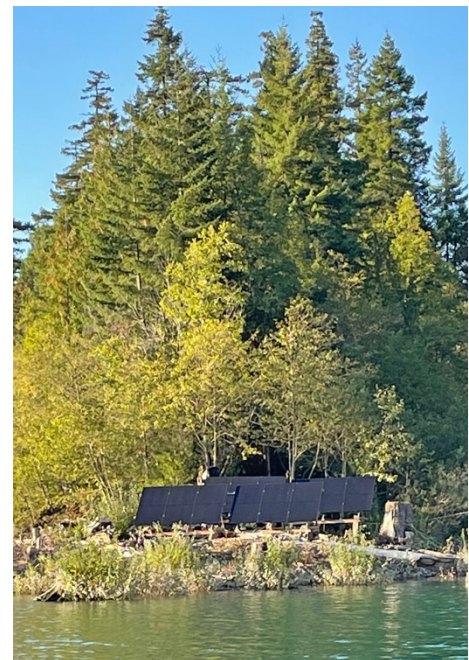
Paneles solares en el Lago Daisy

En vez de depender únicamente del agua como nuestra única fuente de energía, decidimos que necesitábamos diversificar y agregar energía solar para superar los periodos secos. Gracias a generosas donaciones, se recaudaron los fondos necesarios para seguir adelante. Hubo alguna complejidad para hacer el maridaje de la energía hidroeléctrica con la solar, pero nos orientó un comerciante local con muchos años de experiencia en energía alternativa. Con una dosis de pensamiento “fuera de la caja”, algo de lenguaje eléctrico bastante confuso y una tirolesa, logramos instalar 12 paneles solares en el lago. ¡Qué diferencia hicieron! De inmediato, más que duplicamos nuestra capacidad de generación de energía. Sorprendentemente, incluso cuando el cielo está nuboso, estos paneles producen una cantidad generosa de amperios.