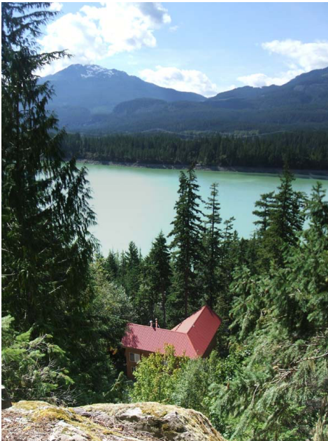
Albergue principal del SSRC, con vista al Lago Daisy y la Montaña Cloudburst en el horizonte

la armonía ambiental y establecer la paz, los voluntarios del SSRC coordinan la colocación de Vasijas de Paz en lugares cuidadosamente seleccionados en todo Canadá. Los retiros en el SSRC para los miembros de la comunidad de Siddhartha's Intent son conducidos de acuerdo con la tradición del linaje Khyentse, del fundador del SSRC, Dzongsar Khyentse Rinpoche. Sin embargo, el SSRC también proporciona un ambiente contemplativo para practicantes de múltiples tradiciones que aspiran a la no-violencia y buscan equilibrio interior. Aunque tiene su propio camino distintivo de meditación, estudio y acción, el linaje Khyentse es famoso en el Tíbet por la diligencia de sus portadores en ayudar a sostener la integridad de muchas diferentes tradiciones. En consonancia con tal actividad no sectaria , SSRC alberga diversos programas, abarcando muchos caminos espirituales. Cada retiro en grupo es conducido a su única y particular manera.